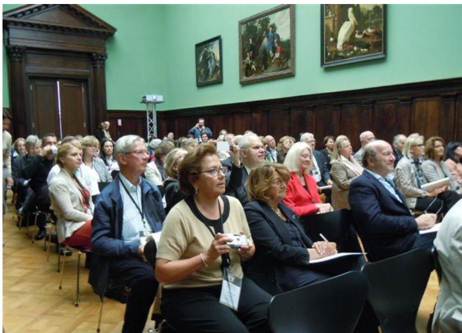
Engagerede museumsvenner fra hele verden. Læg mærke til Arne Jacobsens 7-eren.

Forud for generalforsamlingen den 14. maj afholdtes møde i WFFMs råd, som består af landsorganisationernes repræsentanter. På mødet godkendtes præsidentens beretning og kassererens regnskab samt strategien for det kommende år, ligesom tid og sted for det næste årsmøde blev fastlagt.