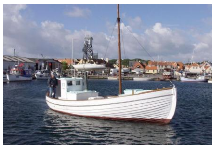
Foto herover: Kutteren Elisabeth K571 Foto til højre: Galionsfigur på Dragør Museum Foto øverst til højre: Dragør Museum.

Hør om byens mange maritime bestillinger. Om sømænd, skippere, lodser og bjærgningsmandskab. Få fortællingerne om sejskibenes storhedstid og søfolkenes betydning for byens liv.