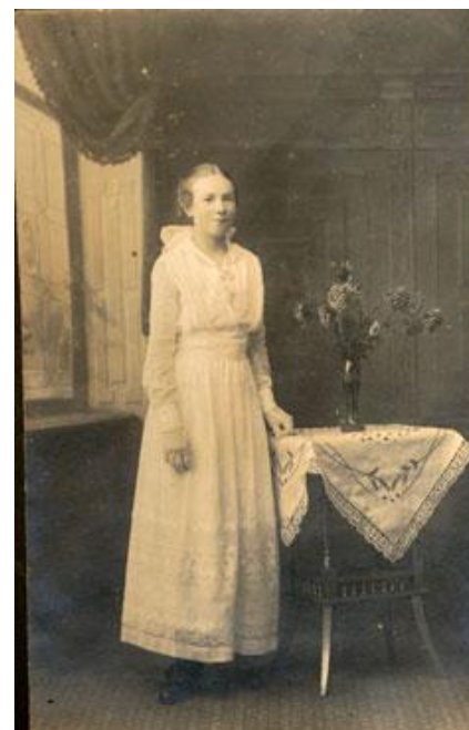
Museet gennemfører p.t. en udstilling af konfirmationsdragter.