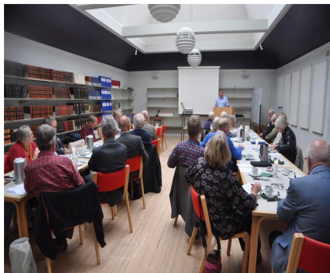
Foto: Fra Ovenlyssalen, hvor TEMA-mødet blev afholdt.