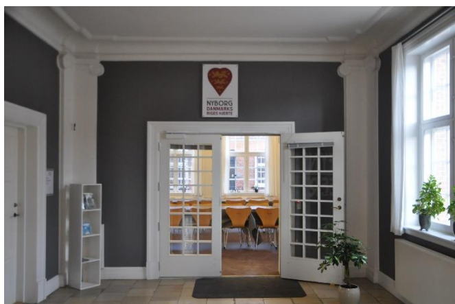
Indgang til mødelokale til Årsmødet.

Med dette nyhedsbrev udsendes kontingent-opkrævning. Vi beder venligst foreningerne snarest muligt opføre og indsende deres kontingent til landsforeningen.